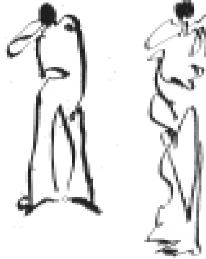
Teckning: Kristina Saxon Grant